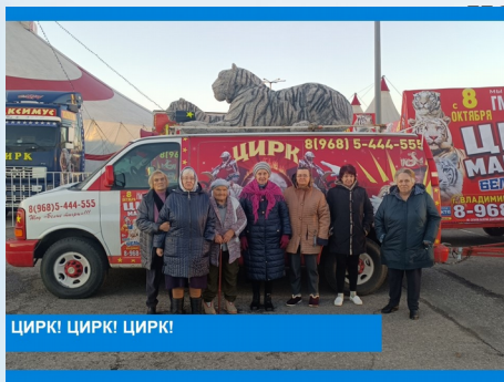
ЦИРКИ! ЦИРКИ! ЦИРКИ!