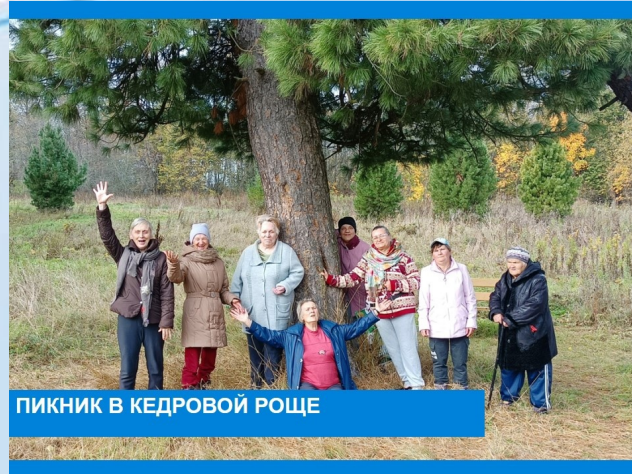
ПИКНИК В КЕДРОВОЙ РОЩЕ