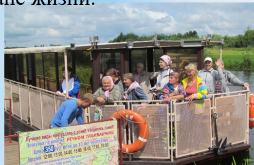
Лучше всего отдохнуть в тени Успенской церкви! Прокатка по реке Сузе РЕЧНОМ ТРАМВАИЧКЕ Цена 850 руб. Дети до 10 лет бесплатно! Время 12.00, 13.00, 14.00, 15.00, 16.00, 17.00, 18.00 Экскурсионно-рекреационная служба ГБУСОВО «Суздальский дом-интернат для престарелых и инвалидов»